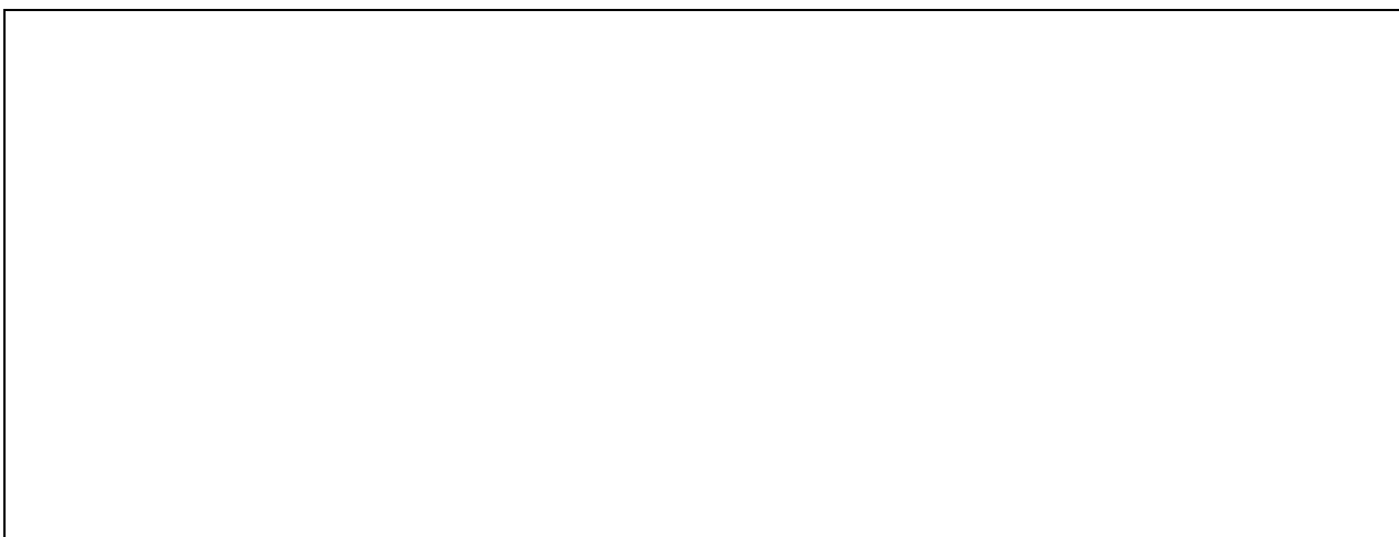
Фото № _____.

Краткая характеристика объекта земельных отношений и объектов, находящихся на проверяемой территории.